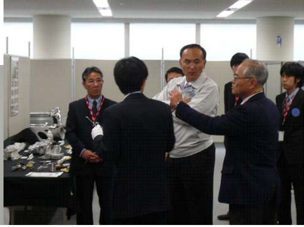
光生アルミニウム工業(株) 展示会の風景