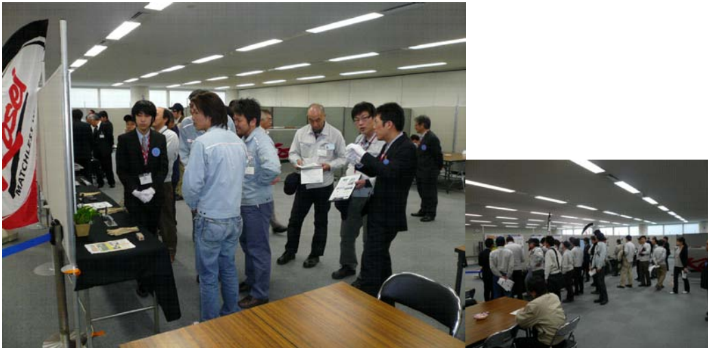
VEセンターにて展示会を開催、熱心に聞き入るトヨタグループの皆さん

3月8日～10日の3日間、トヨタ技術本館内のVEセンターにて、当社では初となるトヨタグループ向け技術展示会を開催させて頂きました。3日間で650名を越える方々にご来場賜ることが出来、更にトヨタ役員の方々にも足を運んで頂きました。