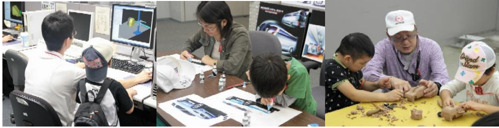
「コンピューターに釘付け」