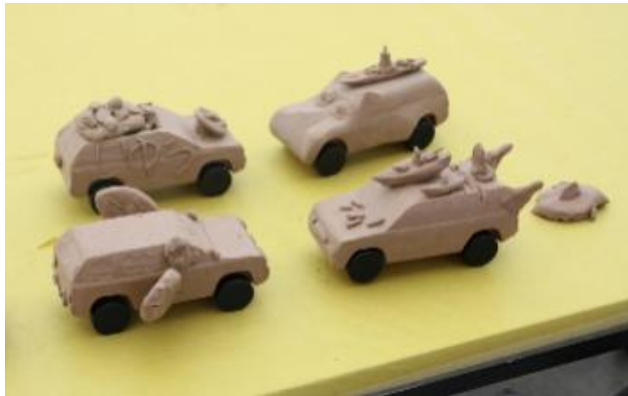
「元気なクレイモデルの完成」

開催に当たっては、安全や機密保持への配慮など事前準備は大変でしたが、興味津々で楽しそうな子供達からは、たくさんの元気とパワーをもらいました。あっという間の2時間でしたが、家族の絆を深めることができ、今まで以上に社員のモチベーションも上がりました。