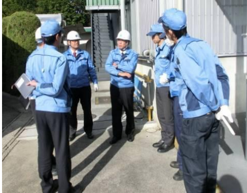
(①トップ自らによる点検)