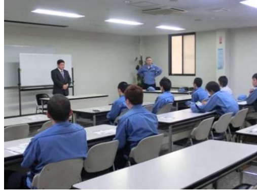
(②フォークリフト講習会)