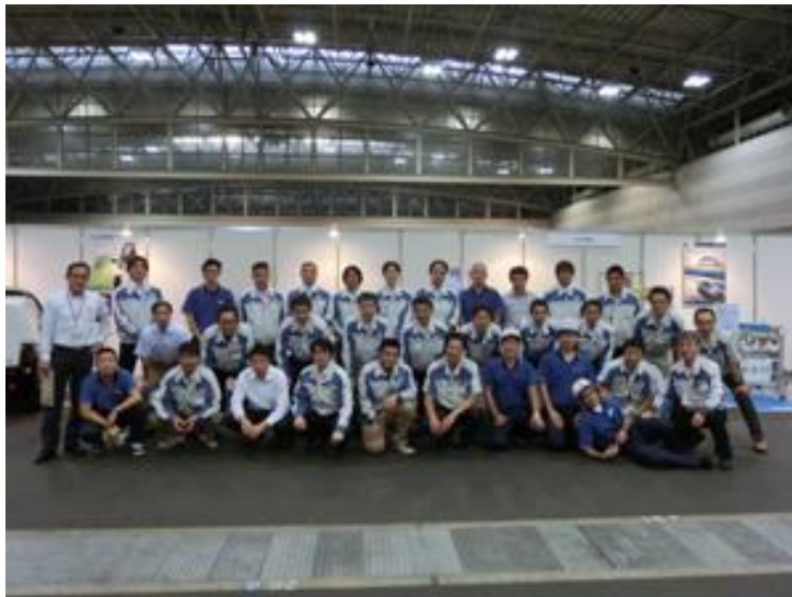
〈知恵と工夫を凝らした 22 作品を出展し、最多出品賞も受賞〉