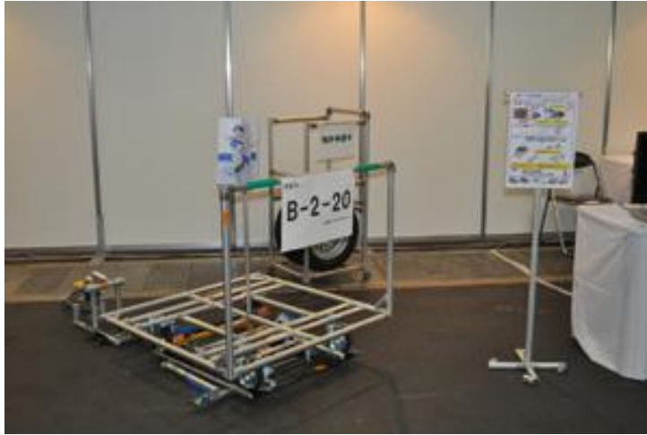
〈最優秀からくり改善賞を受賞した台車トリプルアクセル!?!〉