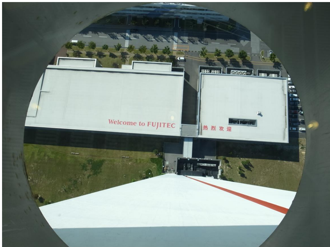
<エレベーター研究塔から第一・二工場を覗いた写真>