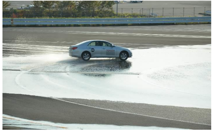
低ミュー路での走行体験