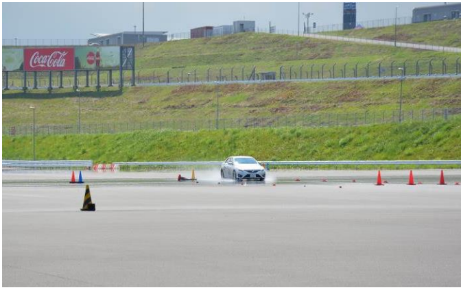
高速フルブレーキ実習