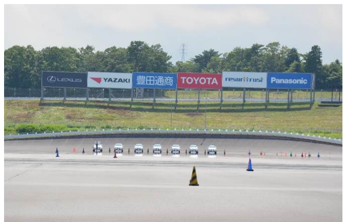
安全講習スタンバイ