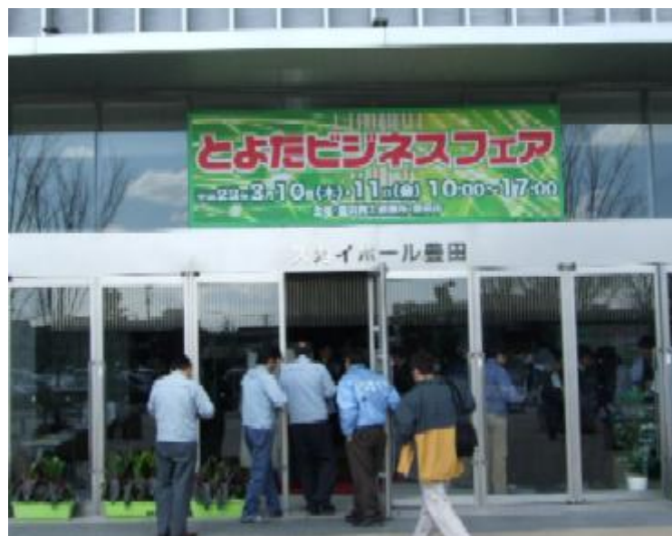
「とよたビジネスフェア会場」

これを機会に、豊田市の「ものづくり文化」が更に全国に広まり、今回の展示製品が新たなビジネスチャンスとして発展することを期待しています。