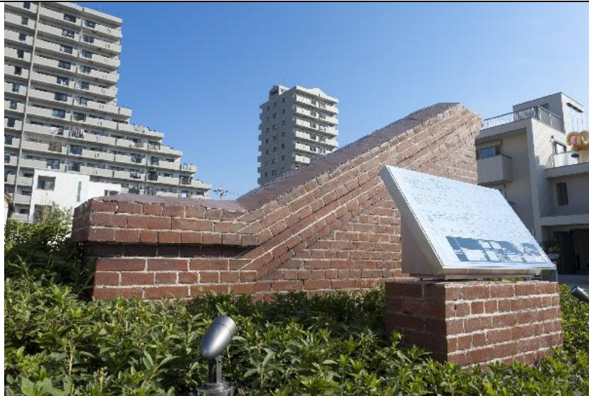
赤レンガ壁モニュメント①

豊田合成株式会社は、旧名古屋工場跡地（旧本社所在地）である名古屋市西区菊井町に、豊田佐吉ゆかりの「赤レンガ壁」を保存したモニュメントを新たに建設した。2011年10月8日より公開を開始している。