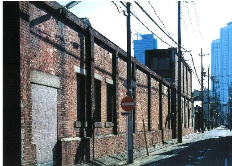
2005年頃の豊田合成 旧名古屋工場