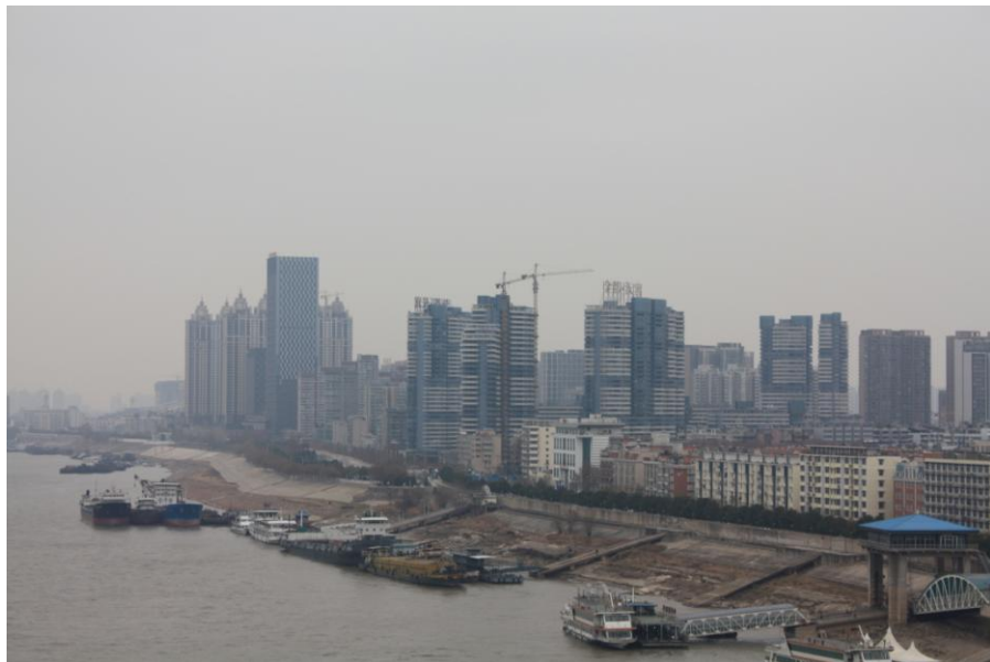
「武漢市のビル郡を望む」