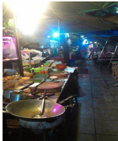
日中は静かな歩道であるが夜になると屋台が出現

客層のほとんどはタイ人の方々であり、日本人が珍しく、2、3度通うと“友達”という事になってしまう。こちらの屋台は日曜定休日となっているが、テーブルを一つだけ出して店員さん達が酒盛りしている事もしばしばで、たまたま通り掛かると強制参加させられる事も・・・