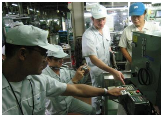
品質道場の現場活動