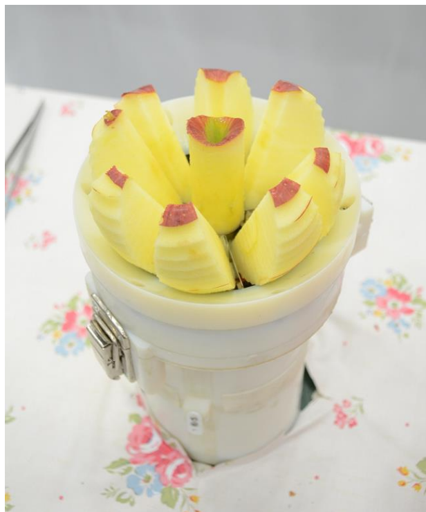
グランプリ「ポン・デ・リンゴ」

見学者の投票と専門家らの審査の結果、アイデア作品グランプリには、器に 1 個のリンゴを入れ、ふたをしてスイッチを入れるだけで、皮をむいて・芯も抜け・八つ切りにして花のようにきれいに盛り付ける一連の動作を 8 秒で行う「ポン・デ・リンゴ」が選ばれました。