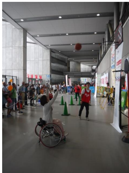
【車いすバスケット体験会 風景】

車いすバスケット体験会では、簡単そうで難しい車いす操作やドリブル、また腕力だけでシュートを打つことは想像以上に力があることを参加された方々が存分に体験されました。