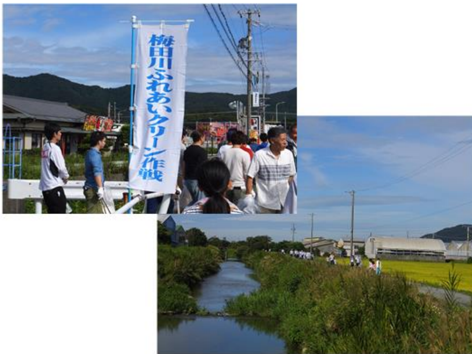
【梅田川ふれあいクリーン作戦 2017 の風景】

最後にはゴミもきれいに無くなり、草むしりを始める方もおられ草に隠れた道しるべや反射板も顔を出し、これで事故が少しでも減ることと信じ、ボランティア活動を終えました。