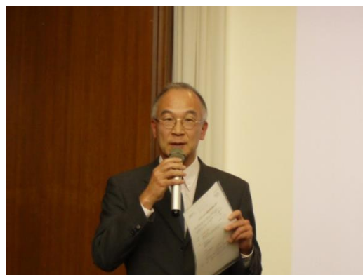
【大村局長による全体講評】

グループ研修報告会終了後、2017年度の活動の締め括りとして参加メンバー同士の親交を深める懇親会も合わせて開催し、充実した一日を過ごすことが出来ました。