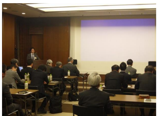
【グループ研修報告会の様子】