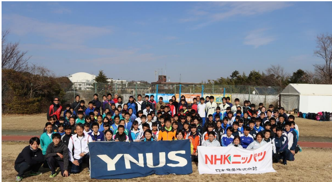
YNUS & ニッパツ 陸上跳躍教室 2018.1.21 (日) 横浜国立大学グランド