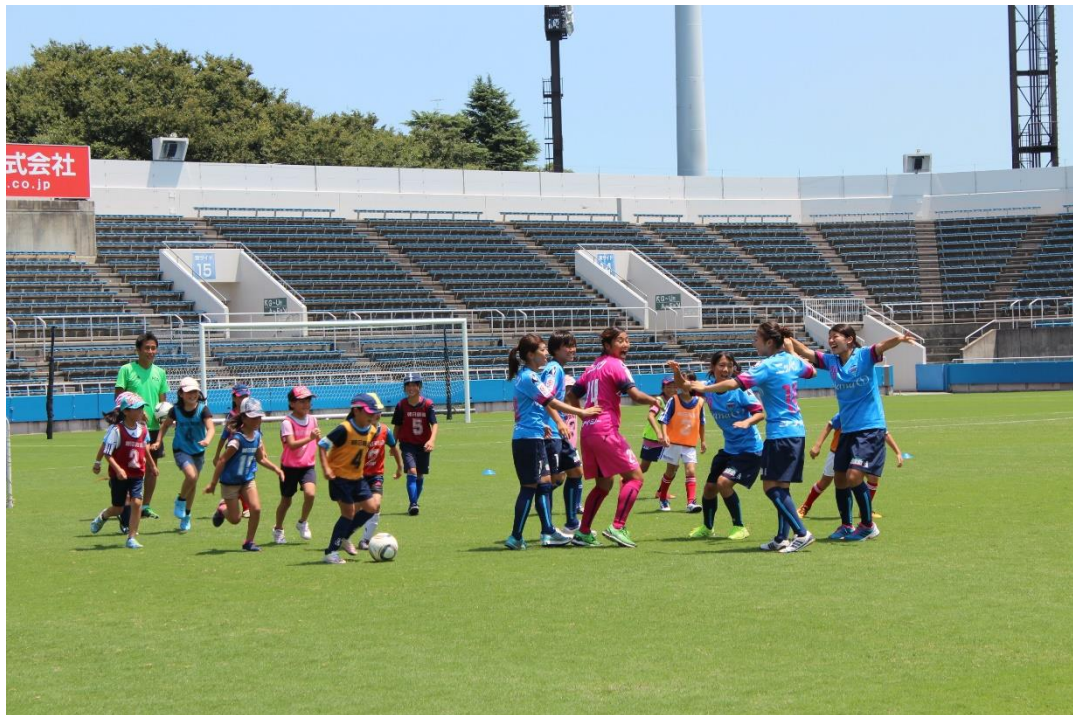
【当社アスリートが、社会貢献活動の一環として、各種イベント（陸上・サッカー教室） において、子どもたちへの指導役として参加】